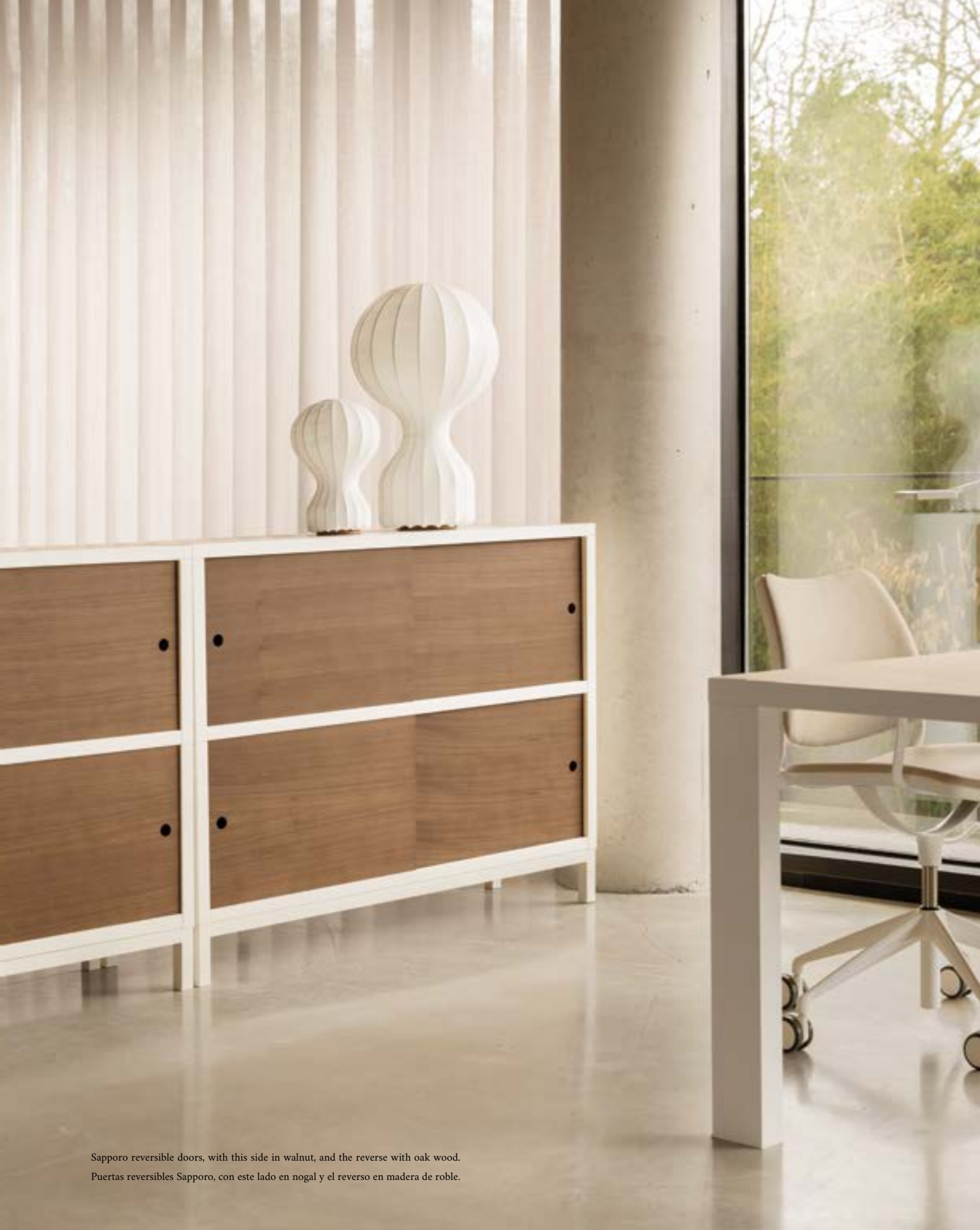
Sapporo reversible doors, with this side in walnut, and the reverse with oak wood. Puertas reversibles Sapporo, con este lado en nogal y el reverso en madera de roble.