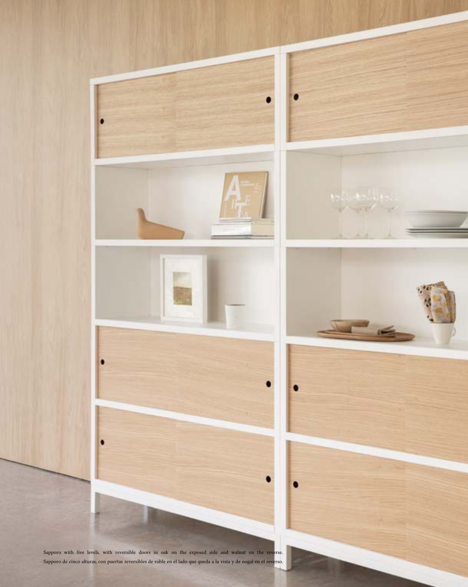
Sapporo with five levels, with reversible doors in oak on the exposed side and walnut on the reverse. Sapporo de cinco alturas, con puertas reversibles de roble en el lado que queda a la vista y de nogal en el reverso.