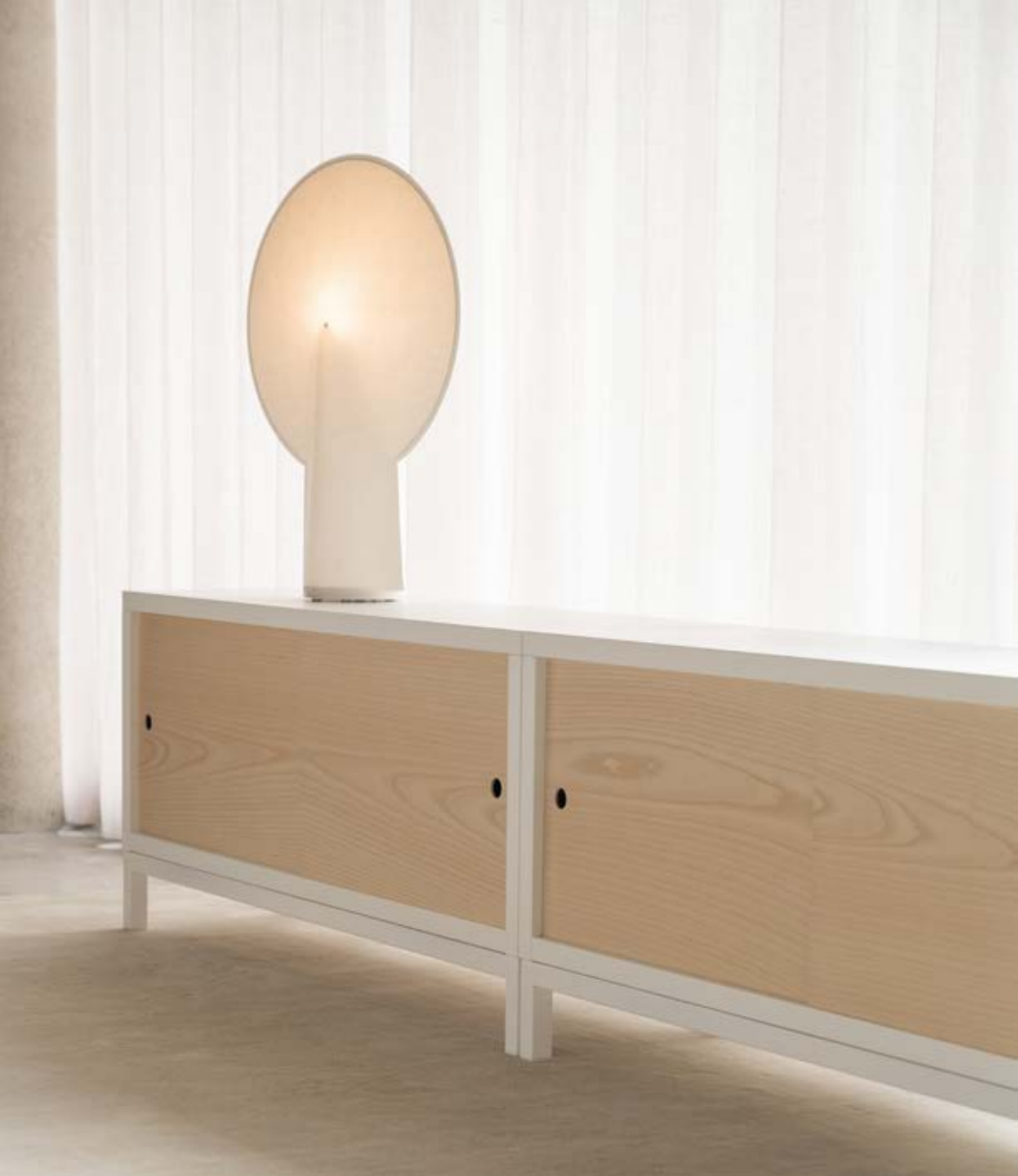
Sapporo reversible doors, with this side in ash, and the reverse with white stain finish. Puertas reversibles Sapporo, con este lado en fresno y el reverso en acabado teñido blanco.