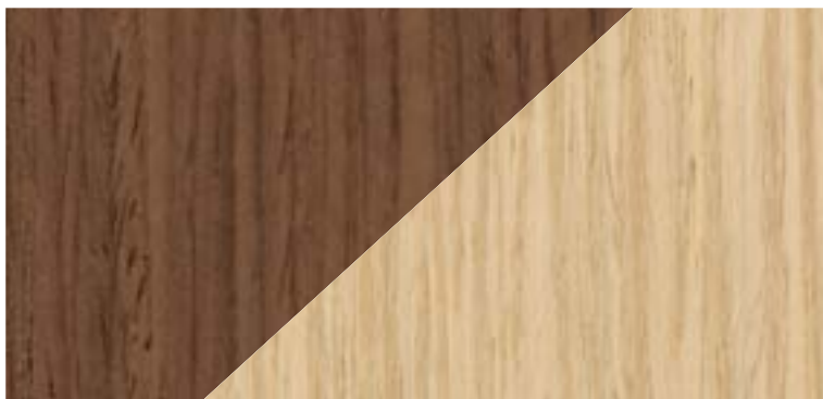
STAINED IN WALNUT TONE TEÑIDO TONO NOGAL