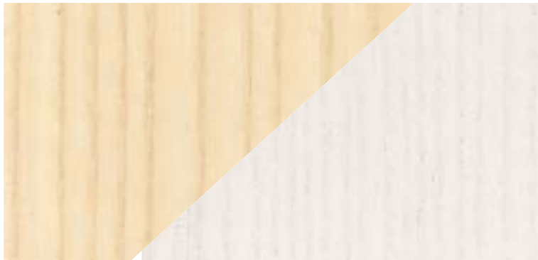
NATURAL ASH FRESNO NATURAL