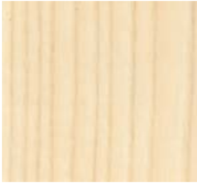
NATURAL ASH FRESNO NATURAL