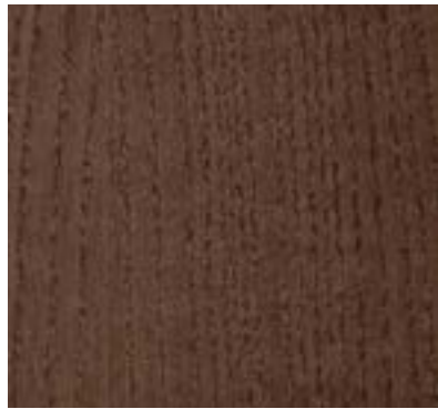
STAINED IN WALNUT TONE TEÑIDO TONO NOGAL