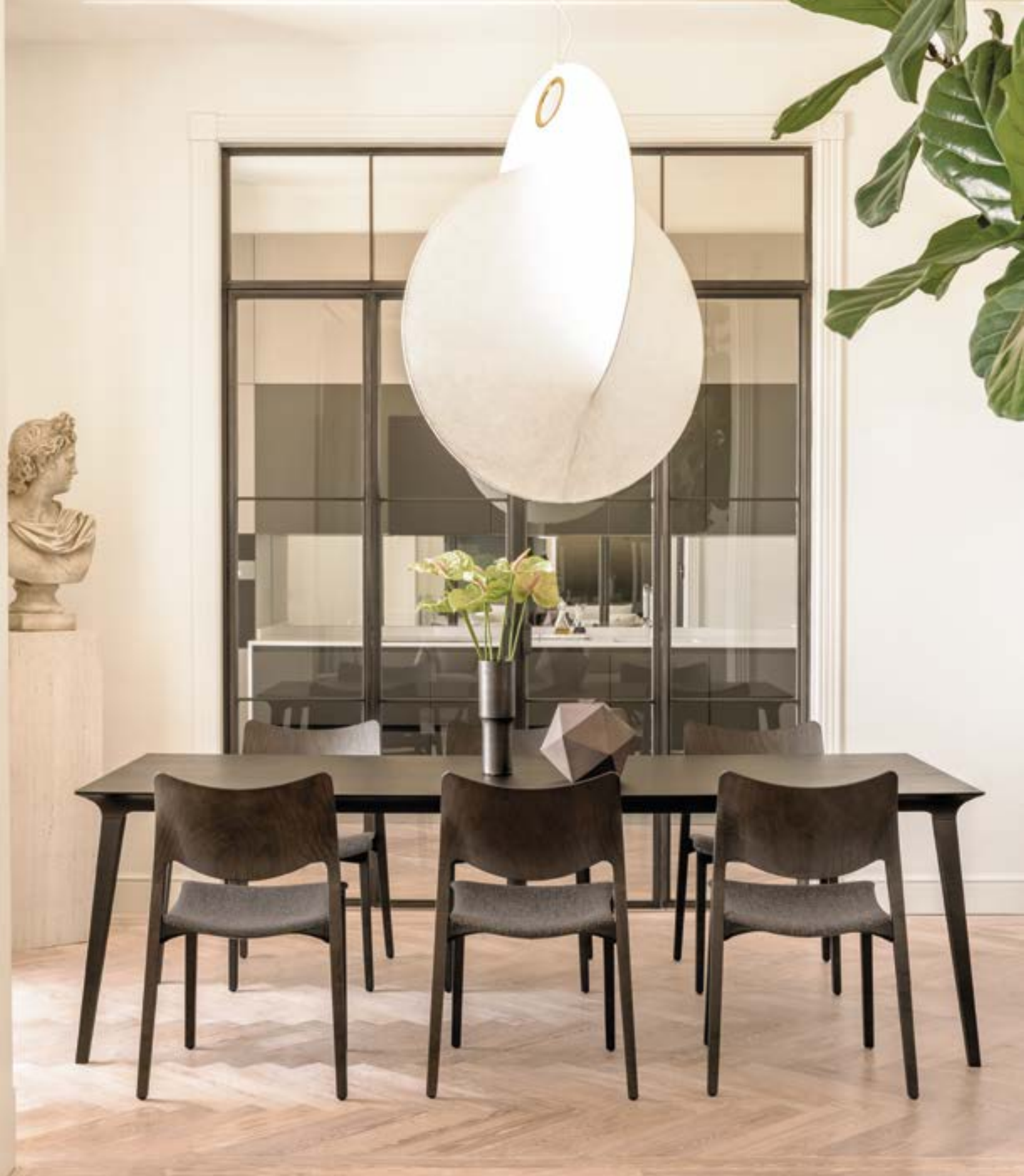
This Lau table measures 100 x 240 cm and is made of warm grey stained ash. The large Lau tables measuring 90 x 180 cm and 100 x 240 cm feature this thicker frame. Esta mesa Lau mide 100 x 240 cm y está fabricada en fresno teñido de gris cálido. Las mesas Lau grandes de 90 x 180 cm y 100 x 240 cm presentan este marco más grueso.