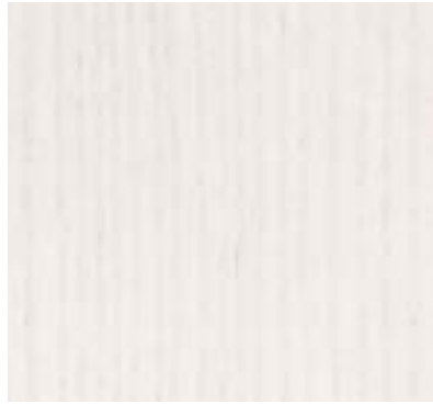
WHITE STAINED TEÑIDO BLANCO