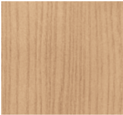
STAINED IN OAK TONE TEÑIDO TONO ROBLE