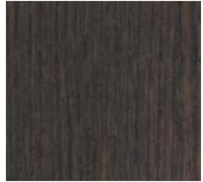
WARM GREY STAINED TEÑIDO GRIS CÁLIDO