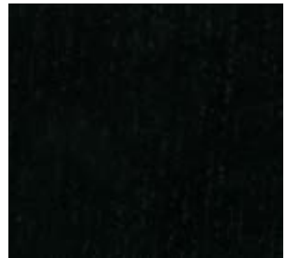
BLACK STAINED/LACQUERED TEÑIDO/LACADO NEGRO