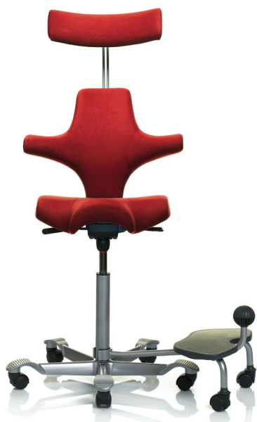
HÅG Capisco 8107 (lisävarusteena HÅG StepUp) ®