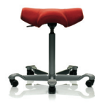
HÅG Capisco 8105