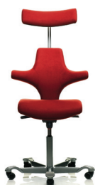
HÅG Capisco 8127