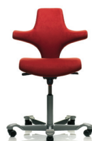
HÅG Capisco 8126