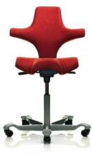
HÅG Capisco 8106