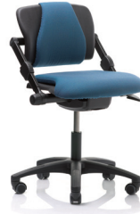
HÅG H03 330