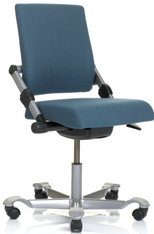
HÅG H03 350 (lisävarusteena alumiini jalkaristikko)