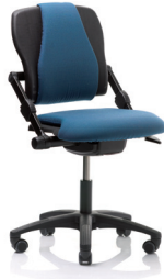
HÅG H03 340